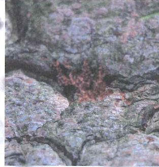
Drtinky na patě stromu.

Včasná asanace napadených stromů s využitím všech dostupných metod zabrání nebo omezí napadení dalších stromů a tím se vynaložené náklady vrátí. Je nutné brát v potaz omezení jednotlivých metod a zohlednit je pro konkrétní situaci.