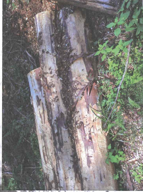
Asanace pomocí odkornění.

Ruční odkornování je velice účinné (nelze jej ale použít ve stádiu žlutého brouka s výjimkou odkornovacích adaptérů na motorovou pilu). Oloupání kůry z pokáceného kmene v malém množství nevyžaduje pro fyzicky zdatného vlastního zásadní náklady, kromě investice do vlastního času a často je pro drobného vlastníka lesů jedinou dostupnou metodou. Chemická asanace nemá z hlediska vývojového stádia omezení, výkon je vyšší, ale pro drobného majitele lesa existují omezení v zajištění přípravků pro chemickou asanaci. Alternativou je odkornování pomocí adaptérů na motorovou pilu, ale je třeba vlastnit pilu s odpovídajícími parametry.