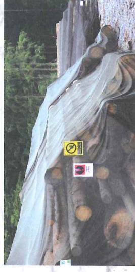
Ochrana skládek pomocí insekticidních sítí.

Asanační metoda odvozem napadeného dříví z lesa byla zavedena v 80. letech, kdy následovalo v průběhu několika dní zpracování, jehož součástí bylo většinou i odkornění. V nedávné době byla tato metoda „modifikována“ na odvoz za hranice lesa, kde lýkožrout dokončí svůj vývoj a „vrátí se“ do lesa, kde napadl další stromy. Toto je proto v současné době zakázáno. Aktivní kůrovcové dříví musí být asanováno!